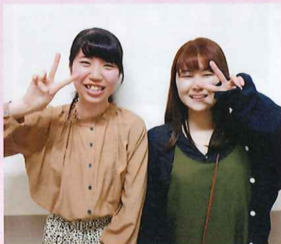
写真は、卒業式以降の3月中旬に撮影したものです