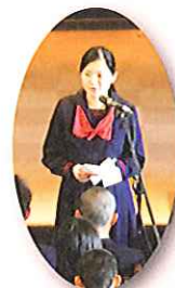
生徒会長による歓迎のこたば