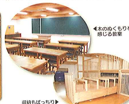
◀木のぬくもりを感じる教室