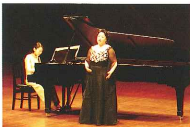
'06.10月1日 熊本県立劇場コンサートホール