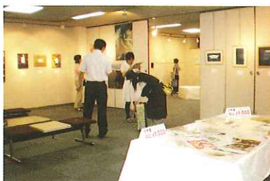
'11.8月3日~8月8日 アートスペース大宝堂(上通り)