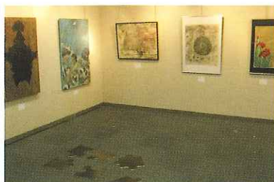
'07.10月3日~10月8日 アートスペース大宝堂(上通り)