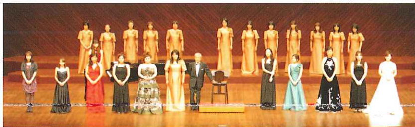
'10.9月11日 熊本県立劇場コンサートホール