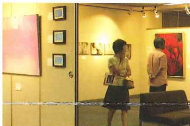
'09.8月5日~8月10日 アートスペース大宝堂(上通り)