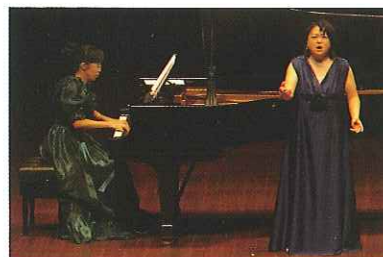
'08.8月30日 熊本県立劇場コンサートホール