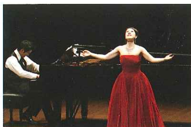
'12.8月24日 熊本県立劇場コンサートホール