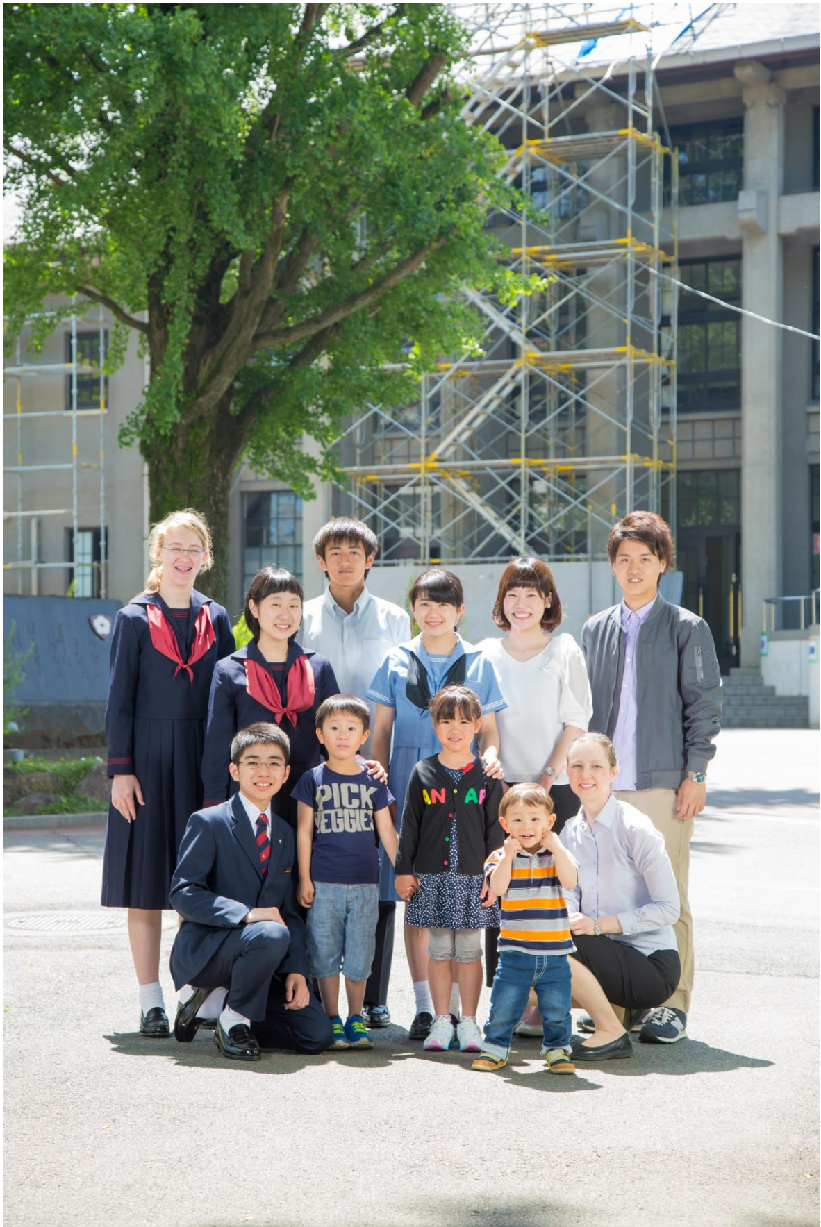
創立 90 周年記念事業の「“学院はひとつ”、ルーテルで集い共に学ぶ、笑顔」の写真