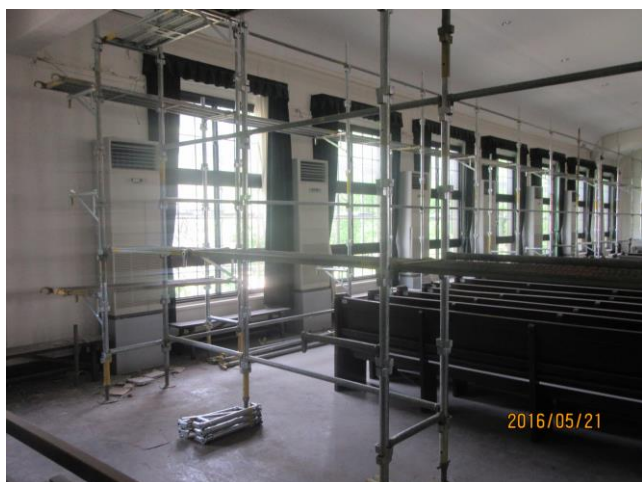
①礼拝堂の修復の様子（天井アーチ補修の足場）