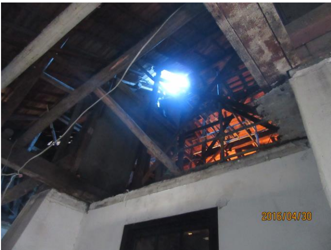
①本館中央屋根部分、煙突落下