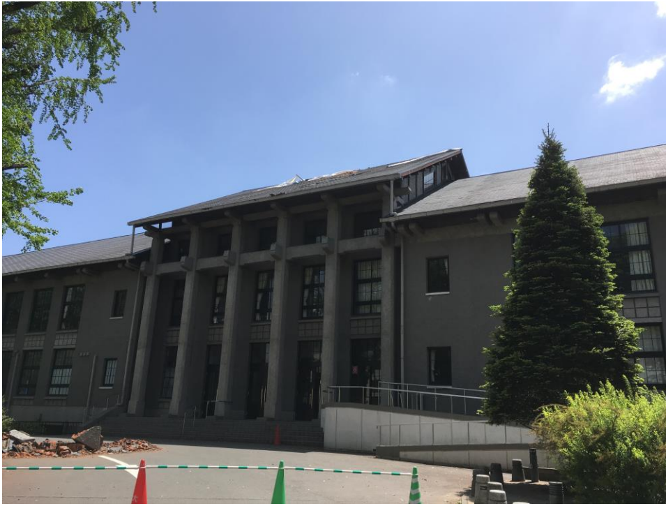
4月16日の本震で崩落した本館シンボルマークの2本の煙突

さて、現在の学院の様子は、結論から端的に申しますと、「5月10日から授業を再開し、子どもたちの笑顔と笑い声が戻りました。復旧・復興の工事の中で多少の不便さはありますが、元気に明るくルーテルらしく学院生活を送っています。」と言えます。ここで、この2か月間のふり返りなどを報告させていただきます。