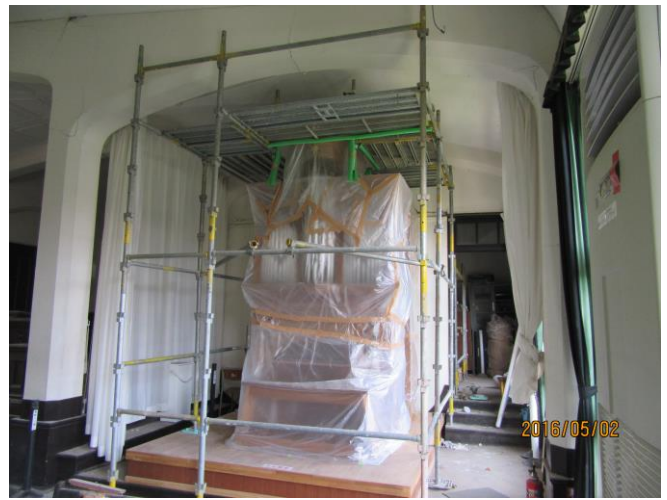
②礼拝堂パイプオルガン