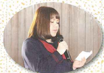
エールを送る宮本生徒会長