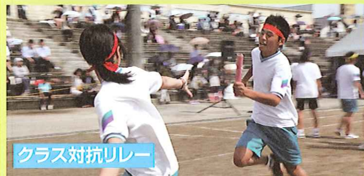
クラス対抗リレー

ルーテル学院の体育大会は毎年5月に開催され、中高一緒に取り組むとても楽しいイベントです。今年も、中学生の大縄跳びや台風の日、高校生の応援団演舞や団対抗リレーなど、見所のある種目があり、大いに盛り上がりました。