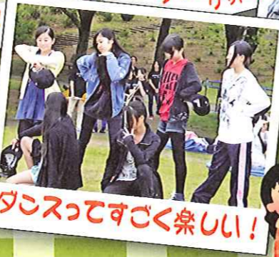
フライングゲット！

4月18日金曜日、合志市にある熊本県農業公園「カントリーパーク」で新一年生を迎える歓迎遠足がありました。前日までは雨が心配されましたが、ルーテルが主を作る生徒もあり、そのおかげで、当日は無事にカントリーパークで楽しいときを過ごすことができました。