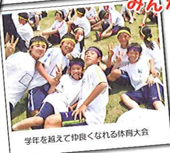
学年を越えて仲良くなれる体育大会