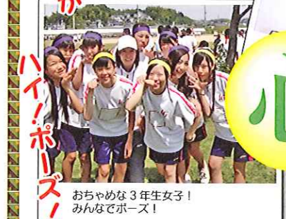
おちゃめな3年生女子！ みんなポーズ！