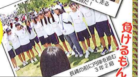
優勝めざし、息を合わせて走る 2年1組、黄団優勝だ！