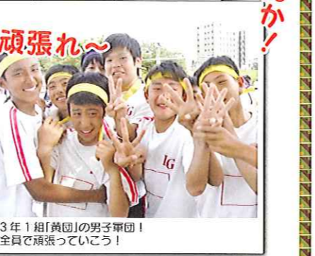
3年1組「黄団」の男子軍団！ 全員で頑張っている！