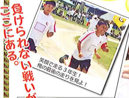
笑顔で走る3年生！ 楯の最後の走りを見よ！