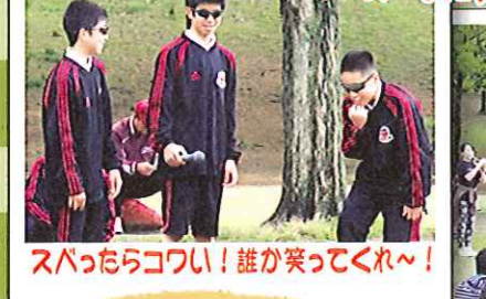
スバったらコワイ！誰か笑ってくれ～！