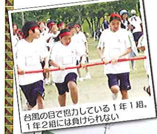
台風の日で協力している1年1組。 1年2組には負けれない