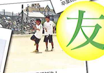
クラス対抗の長縄対決！ 1年1組