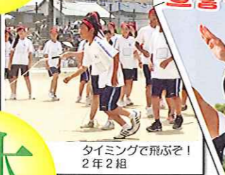
タイミングで飛ばせ！ 2年2組