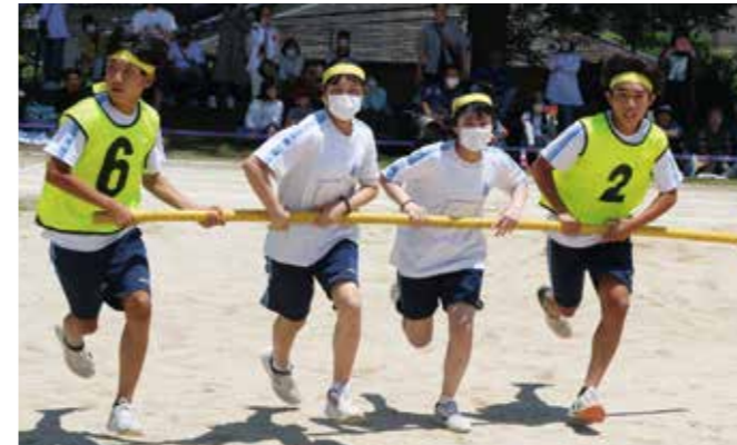
中学だけの体育大会